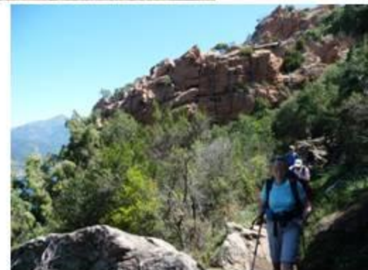
Le château fort