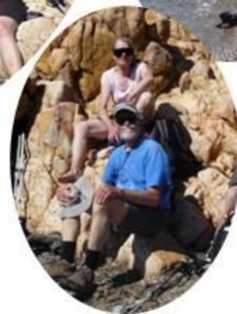
La pause sur la plage de Tuara