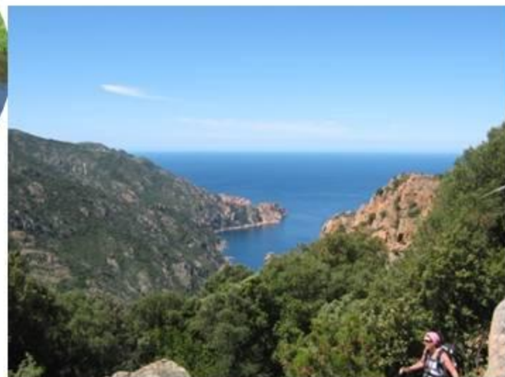
Le golfe de Porto