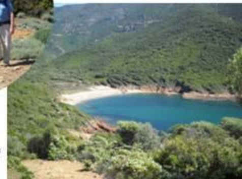
La plage de Tuara