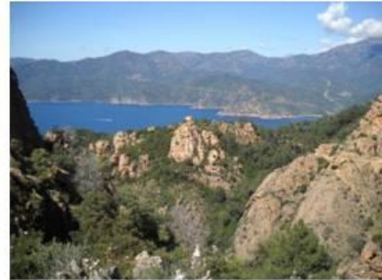
Forme singulière des rochers comme cette tête de chien