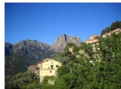
Arrivée à Ota