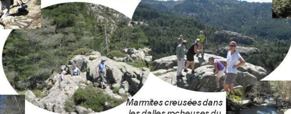
Marmites creusées dans les dalles rocheuses du torrent d'Aitone