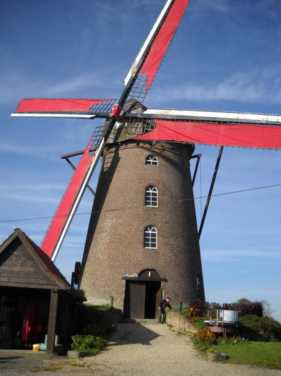
Moulin construit en 1864.