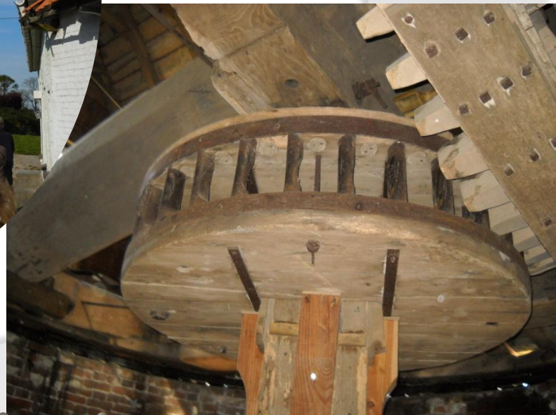
Vendredi 06 mai : visite du moulin Le Steenmeulen