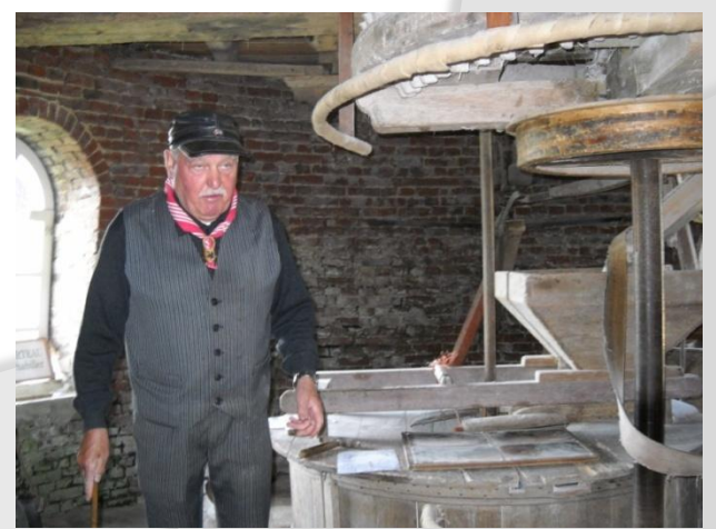
Vendredi 06 mai : visite du moulin Le Steenmeulen