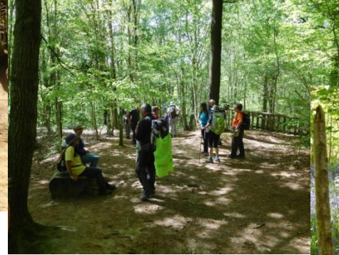
Site Marguerite Yourcenar.