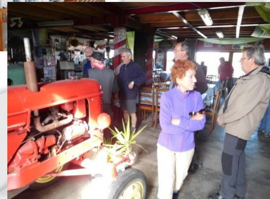
Vendredi 06 mai : visite du moulin Le Steenmeulen